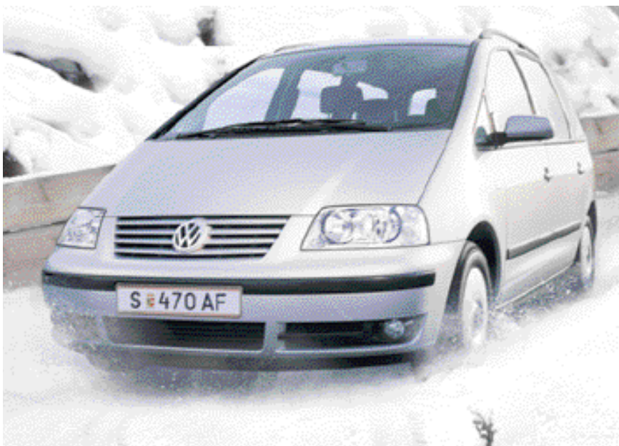
Der Urlaub beginnt oft schon hinter dem Lenkrad, wenn alles bestens verstaut und man durch schlechte Straßenverhältnisse nicht aus der Ruhe zu bringen ist.

Nachdem alles verstaut ist, kommt Test Nummer 2 für die Nerven: Haben alle Insassen genug Platz, hat jedes Kind seinen eigenen Sitz? Natürlich, es handelt sich um den VW Sharan: Das variable Sitzsystem (5 Sitze Serie, bis 7 Sitze optional) bietet auch hier Vorteile, denn es lassen sich selbst bis zu fünf Kinder im Fond so unterbringen, dass sich jeder frei bewegen kann und nicht einmal ansatzweise die Frage auftaucht, ob der Sitzplatz des Nachbarn nicht vielleicht doch der bessere wäre. Außerdem finden die Kinder freie Sicht und durch Tische und Ablagen vielfältigere Spielmöglichkeiten vor. Diese Tatsache erleichtert