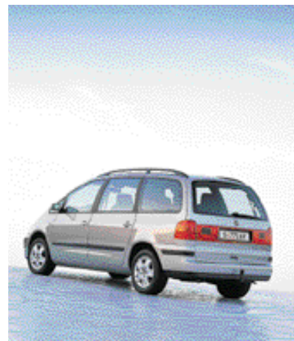
Eine gute Kombination, um immer und überall schnell und sicher sein Ziel zu erreichen: TDI Pumpe-Düse und 4MOTION.