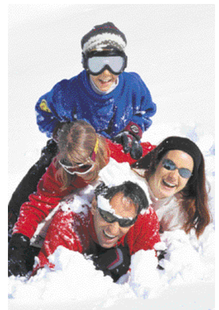
Entspannt losfahren, entspannt ankommen – Spaß für die ganze Familie.