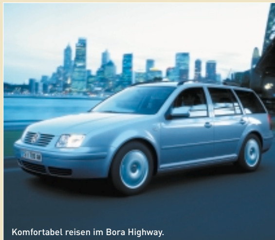
Komfortabel reisen im Bora Highway.

Gönnen Sie sich den Luxus der Oberklasse – zum Sonderpreis. Im limitierten Sondermodell Bora Highway ist alles inklusive, was das Fahren entspannter und das Reisen angenehmer macht: 5-Gang-Automatic mit Tiptronic, Klimaanlage und Dosenhalter (ab Comfortline). Dank des Tiptronic-Getriebes werden Stadtverkehr wie auch lange Überlandfahrten zum reinen Vergnügen – entweder Sie lassen schalten oder können per Tiptronic auch