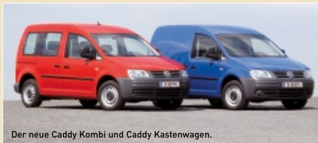
Der neue Caddy Kombi und Caddy Kastenwagen.

Im neuen Caddy kommen vier Aggregate zum Einsatz. Zur Markteinführung stehen der 1,4-Liter-Benzinmotor mit 75 PS und der 2,0 Liter große SDI-Pumpe-Düse-Dieselmotor mit 70 PS zur Verfügung. Die jeweils stärkeren Aggregate werden kurz darauf folgen: ein Benziner mit 1,6 Liter Hubraum und 102 PS sowie ein 1,9-Liter-TDI mit Pumpe-Düse-Technik und 105 PS.