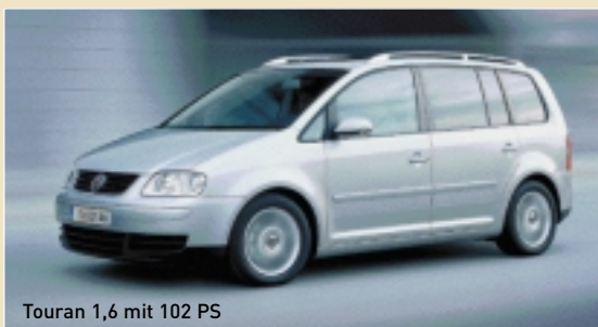
Touran 1,6 mit 102 PS

Für alle Touran-Fans steht mit dem 1,6-Liter-Benzinmotor eine neue und preiswerte Einstiegsmotorisierung zur Auswahl. Der mit einem Fünfgang-Schaltgetriebe kombinierte Vierzylinder leistet 102 PS und beschleunigt von 0 auf 100 in 12,9 Sekunden, die Höchstgeschwindigkeit liegt