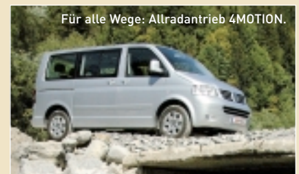
Für alle Wege: Allradantrieb 4MOTION.

kabine-Pritsche und Fahrgestell gibt's in der 131-PS-TDI-Motorisierung als 4MOTION.