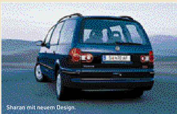
Sharan mit neuem Design.

Österreichs meistgekauften Großraum-Limousine, der Sharan, hat eine neue Optik bekommen. Markantestes Merkmal: das neu gestaltete, moderne Heckleuchten-Design und die breiteren Schweller. Neu ist außerdem die klarer konturierte Motorhaube, die in die Außenspiegel integrierten Blinker sowie die Chromleisten am